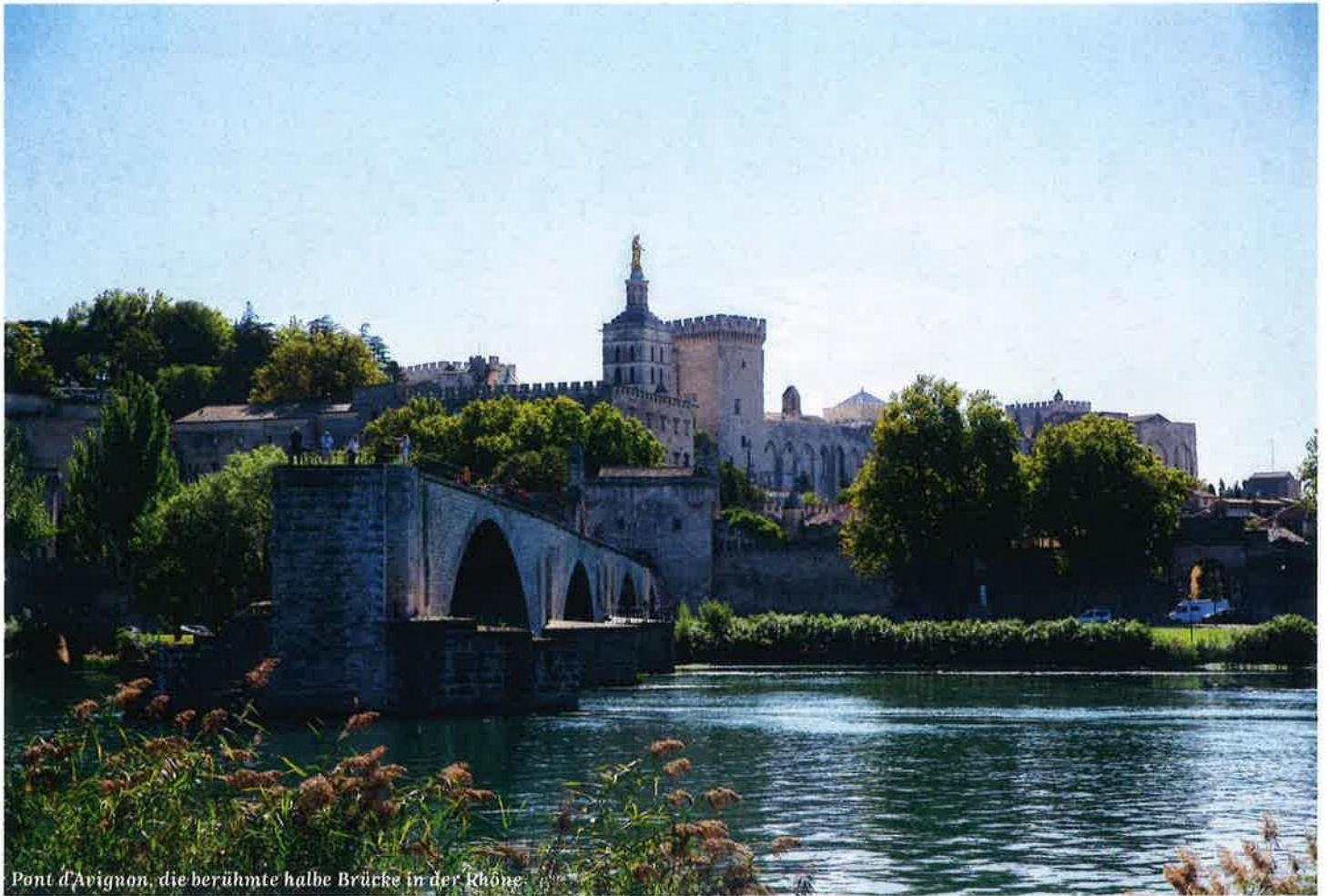
Pont d'Avignon, die berühmte halbe Brücke in der Rhône