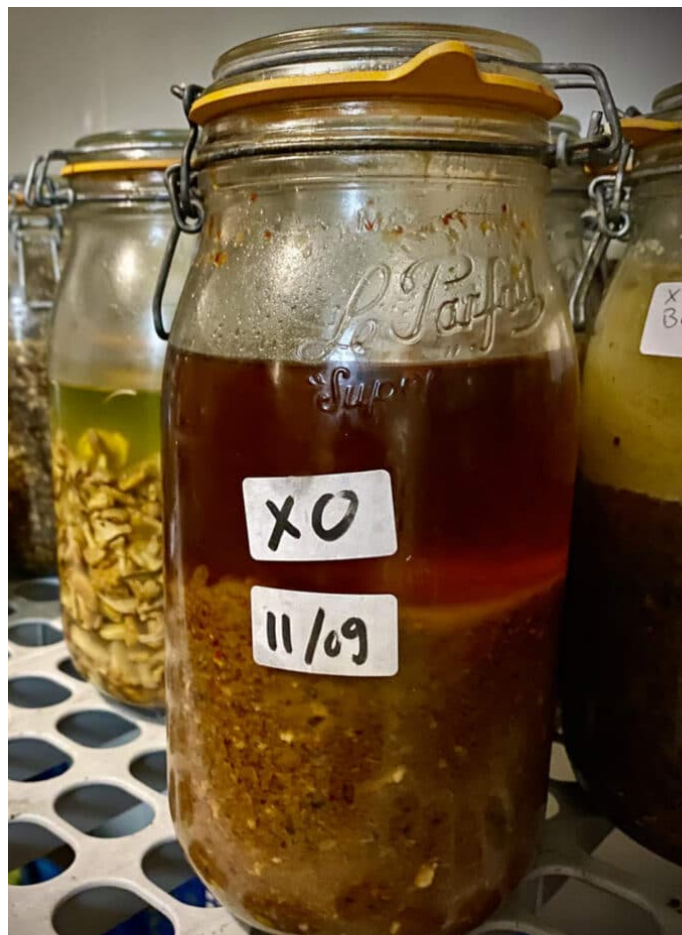
À gauche, dans la chambre froide : squelettes de poissons séchés, et une magnifique pièce de viande maturée 19 semaines. À droite, sauce XO version Pietravalle, un modèle du genre.

Habité par une féconde envie d'inventer, Florent Pietravalle présente cette qualité manifeste de savoir rester au service du bon goût. Dans sa vigueur de « touche à tout », il rappelle son aîné Glenn Viel, le Géo Trouvetout de l'Oustau de Baumanière, proclamé Chef de l'année 2020, plus jeune trois étoiles Michelin français et localisé à moins de 50 kilomètres. Il emprunte peut-être une voie proche de celle tracée par son illustre voisin.